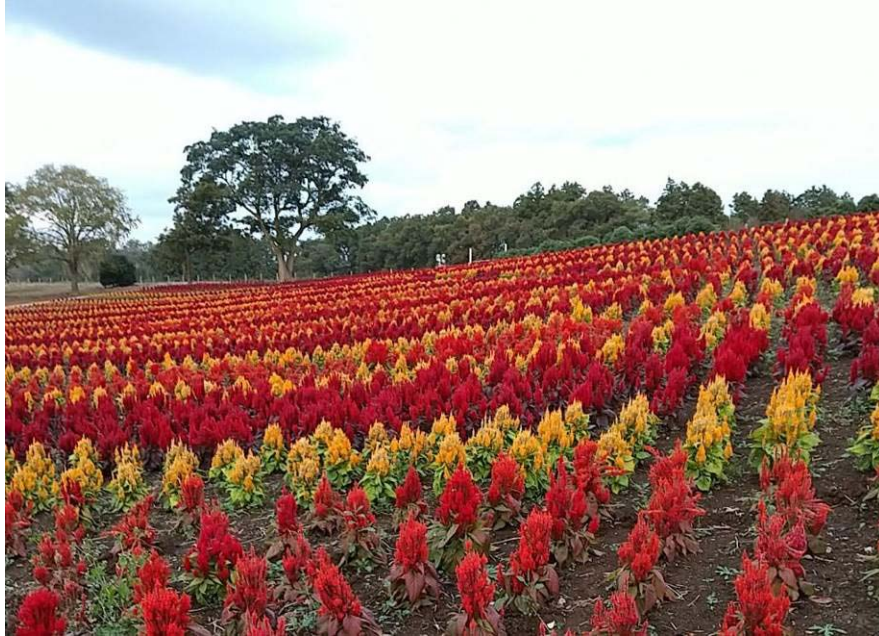
ケイトウ (東京ドイツ村)